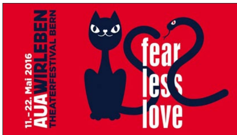
Das AUAWIRLEBEN-Theaterfestival war 2016 mit ihrem Festivalzentrum zu Gast im kulturpunkt im PROGR.