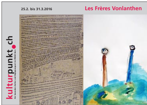
In der Ausstellung «Les Frères Vonlanthen» zeigten die beiden bekannten Créahm-Künstler ihre neusten Werke.