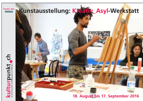
7 geflüchtete Künstler aus 7 verschiedenen Ländern zeigten in einer Gruppenausstellung ihre besten Werke aus dem 2-monatigen Werkstattbetrieb im kulturpunkt.