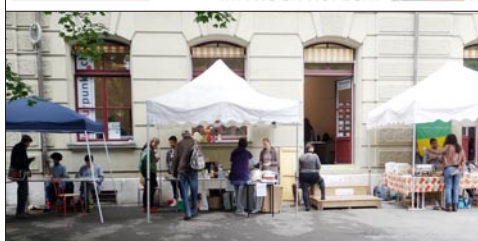
Am 2. Outsider Kunstmarkt (4.6.) bewährte sich der neue Direktzugang vom PROGR-Westhof in den kulturpunkt.