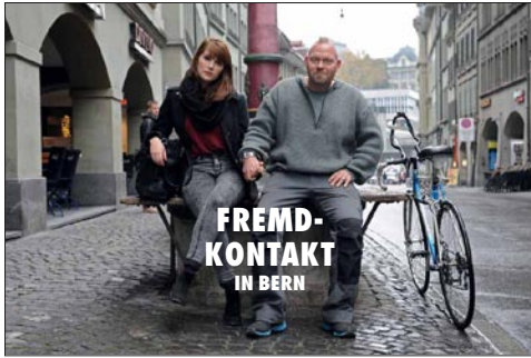
Die Fotoausstellung «Fremd-Kontakt» in Bern stiess bei Besucher/innen und Medien auf grosses Interesse.