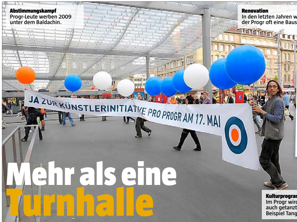
Abstimmungskampf Progr-Leute werben 2009 unter dem Baldachin.