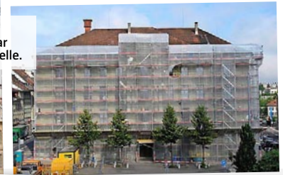
Renovation In den letzten Jahren war der Progr oft eine Baustelle.